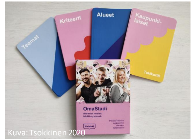
Kuva: Tsokkinen 2020

Lähde: Hautaniemi, A. 2021. Pelillisuus ja motivaatio. Osallistuva budjetointi ja pelillisuus webinaari.